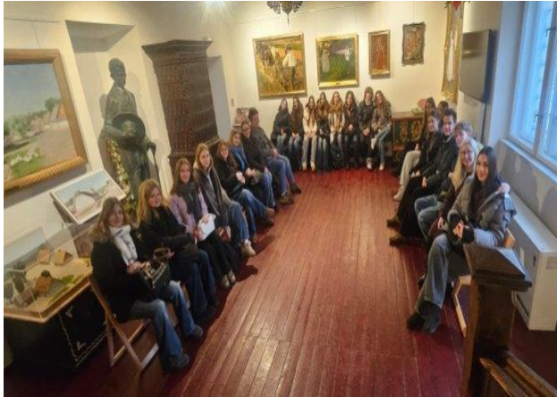
Rydlówka w Bronowicach Małych

Po powrocie do Poznania można było usłyszeć wiele pozytywnych opinii uczestników. Jedna z osób podkreśliła: „Fajne było to, że spacerując po Krakowie, mogłam zobaczyć miejsca znane z lektur z języka polskiego i lepiej zrozumieć to, o czym rozmawialiśmy na lekcjach”. Pojawiły się również liczne wypowiedzi dotyczące świetnej atmosfery panującej zarówno między uczniami, jak i nauczycielami, a taniec wokół Chochoła przed Rydlówką także nie został pominięty we wspomnieniach z wyjazdu.