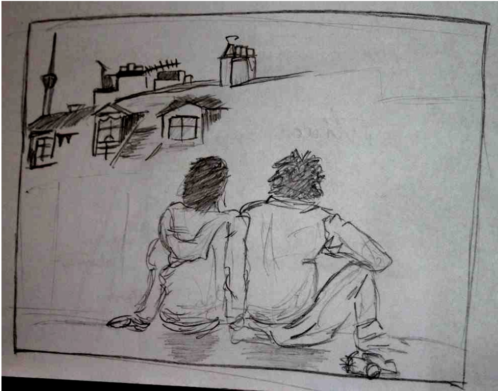
Paulina Cekała III LO – ilustracja do wiersza Ulica poznańska