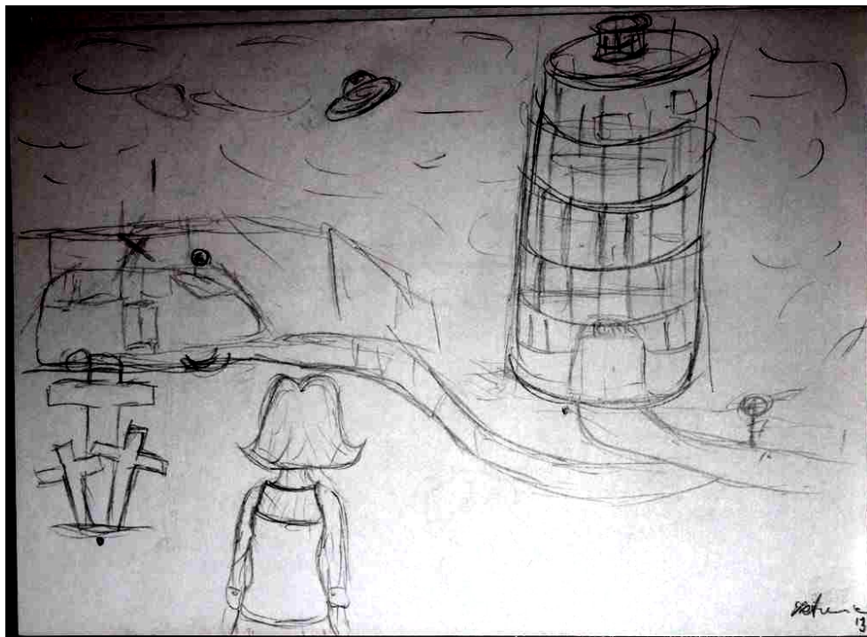
Marta Kunsztowicz – ilustracja do wiersza Mój Poznań