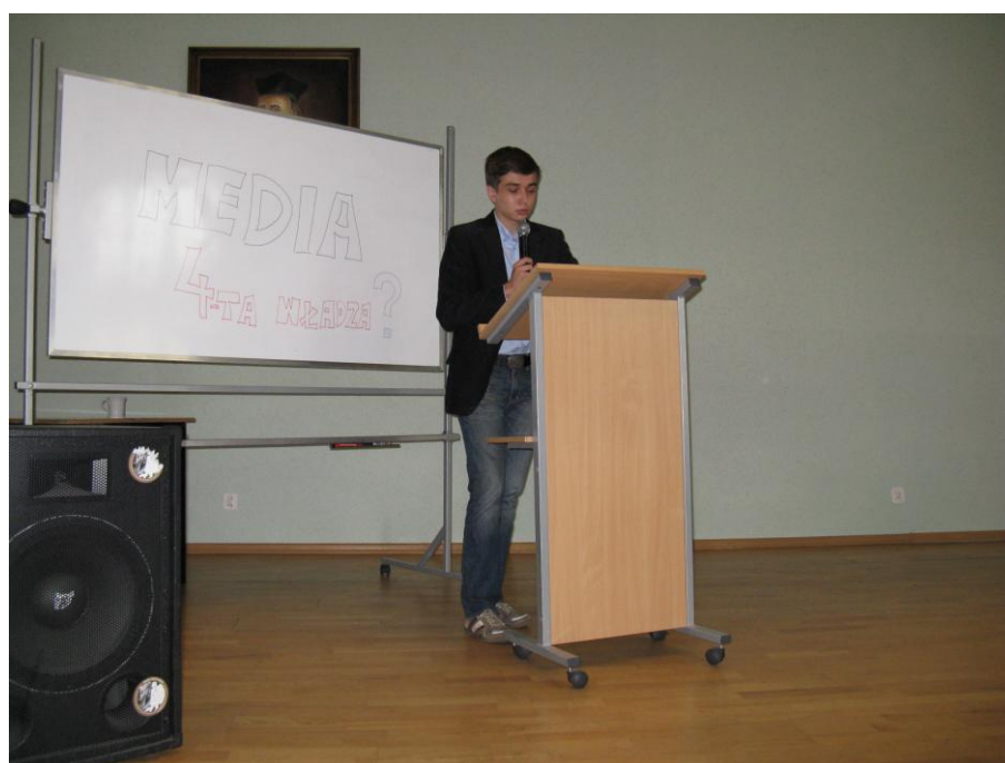
Na zdjęciach: uczestnicy sesji „Media czwartą władzą?”